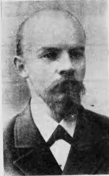
В. И. Ленин. Фото 1900 г.

свои исторические задачи, необходимо было, по мысли Ленина, ликвидировать разобщенность